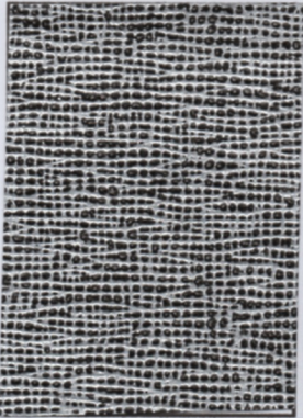
Vare nr: 003 Farve: sort/grå Type: slangepapir