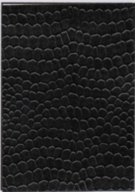
Vare nr: 011 Farve: sort Type: læderpapir