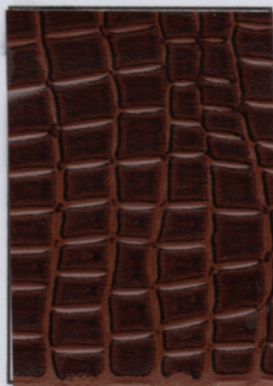
Vare nr: 061 Farve: krokodille Type: læderpapir