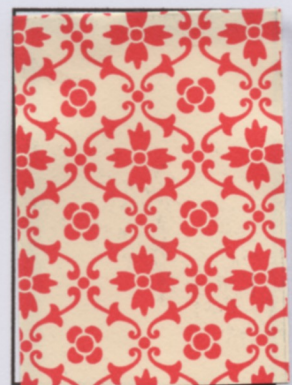
Vare nr: 428 Farve: rød Type: forsats

Als Bogbinderi www.als-bogbinderi.dk info@als-bogbinderi.dk Tlf. 23476040