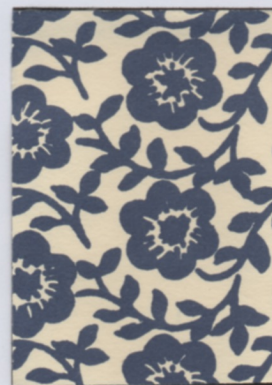
Vare nr: 422 Farve: blå Type: forsats

Har du særlige ønske, har vi stort udvalg gennem vores leverandør.