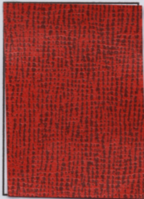
Vare nr: 253 Farve: rød/sort Type: læderpapir